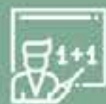
Colegio San Agustín