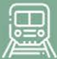
Estación de tren Zaragoza-Goya