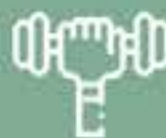
Metropolitan Paraíso Gimnasio