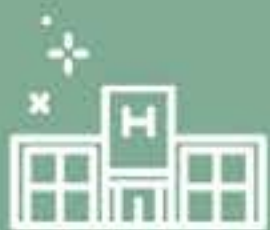
Centro de Salud