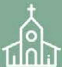
Iglesia San Juan De La Cruz