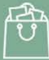
El Corte Inglés Sagasta